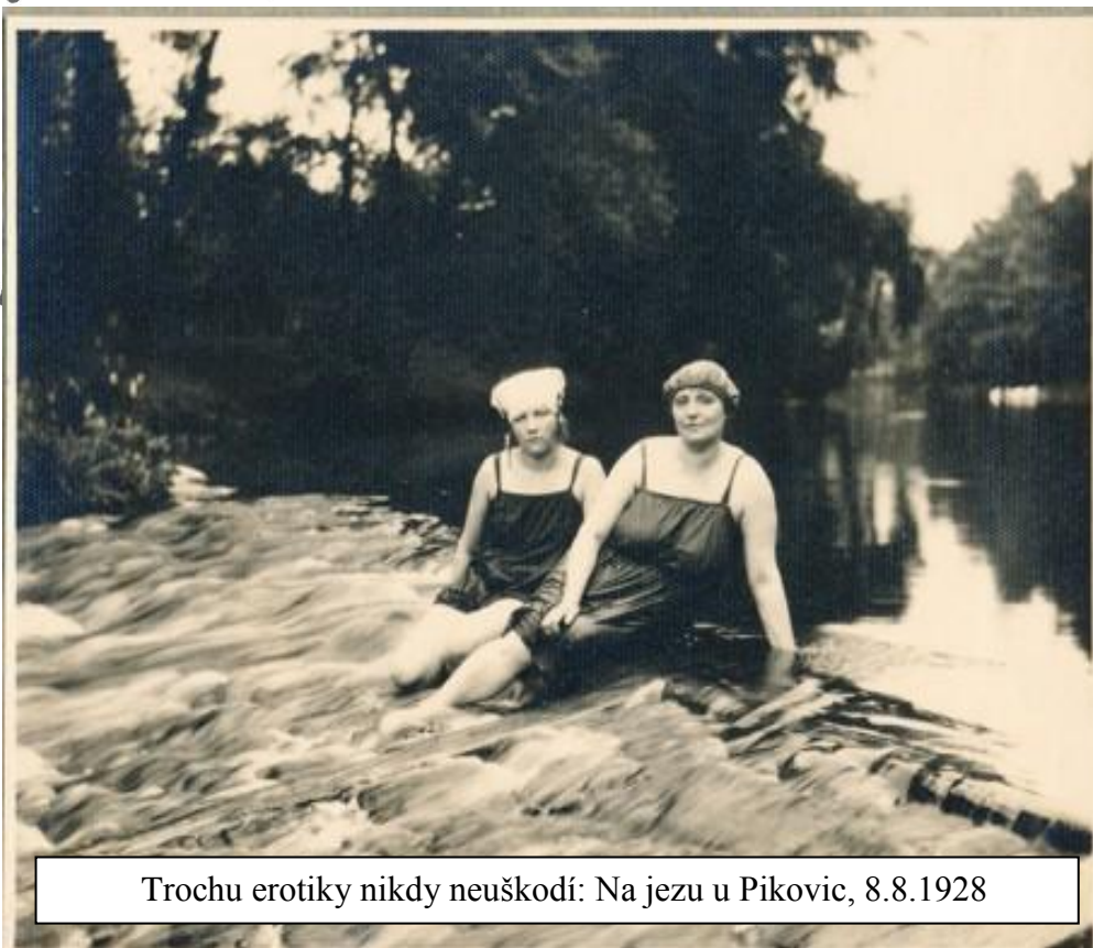
Trochu erotiky nikdy neuškodí: Na jezu u Pikovic, 8.8.1928