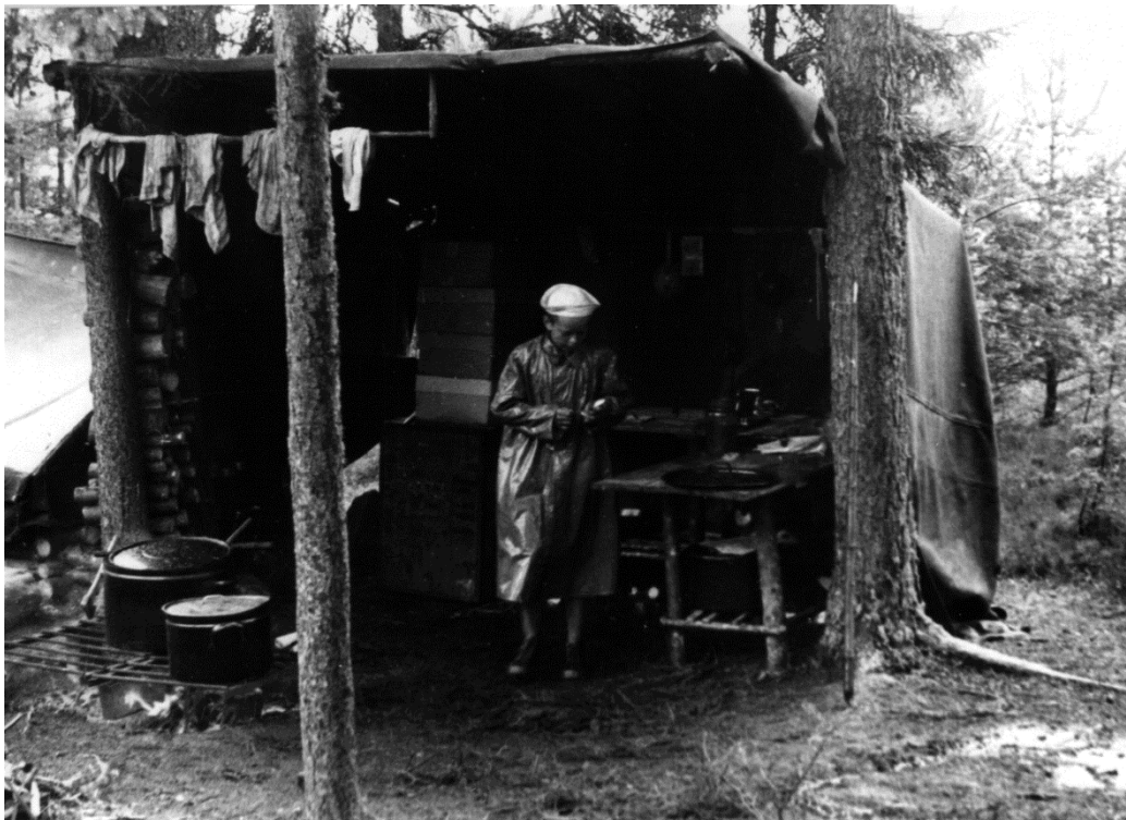
Kuchyně na Souši, kde pořád přšelo, 1957; kdo je ten kuchař?