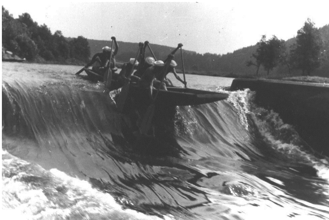
Lužnice, Dolní Lipovsko, 1958: Jespáci: Golfik, Kolumkile (?), Smeták (?), Bob (?), Antonek, na kotrči Loulin, fotografoval Zub (který s fotografií vyhrál nějakou foto fotosoutěž).